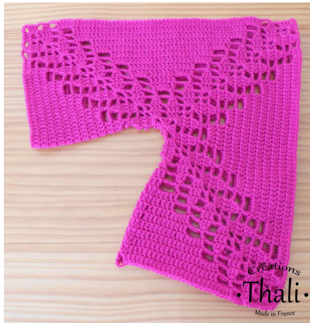
Le granny shrug Forest plié en 2